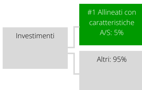
Grafico alimentato da dati:

#1 Allineati con caratteristiche A/S comprende gli investimenti del prodotto finanziario effettuati per il raggiungimento delle caratteristiche ambientali o sociali promosse dal prodotto finanziario.